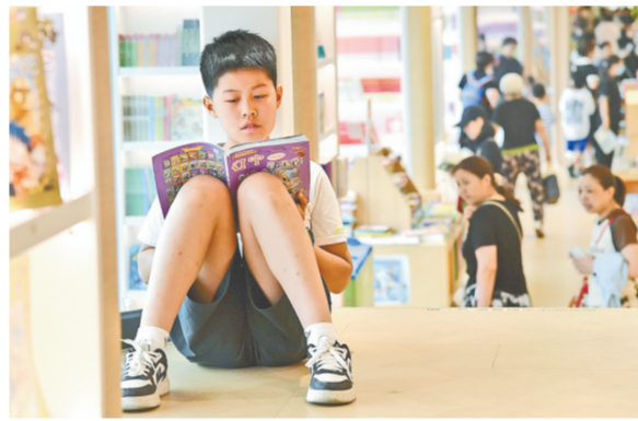
昨日,郑州新华书店凯旋广场店内,众多孩子或坐,或蹲,或站,全神贯注地看书。进入暑期,书店成了孩子们的主要活动场所之一。