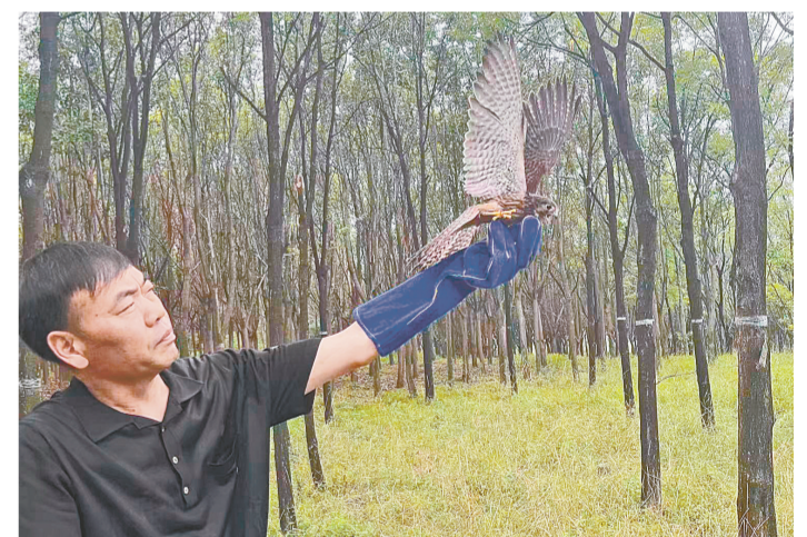
工作人员将一批红隼放归大自然

“野生动物的归宿是大自然,我们救助野生动物的目的也是帮助它们回到自然,但是不同于那些受伤或生病的成鸟,幼鸟尚没有野外生存的经验,所以放归之前我们要对它们进行野化训练。”救护站工作人员说,经过一个月的喂养和训练,有23只红隼已具备放归条件,目前救护站内有30余只红隼,待具备放归条件后,这30余只红隼也会被放归大自然。 据救护站工作人员介绍,郑州市每年至少要救助50只以上的幼年红隼,由此可见郑州红隼种群的数量已经非常庞大。红隼是猛禽,其位于食物链顶端,对生态环境和生物多样性要求较高,它们在郑州的“落户”繁殖,正是郑州市生态环境持续向好的缩影和明证。