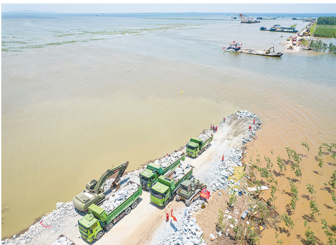
7月7日,在湖南省岳阳市华容县团洲垸洞庭湖大堤决口现场,抢险队伍在进行堵口作业(无人机照片)。

新华社湖南华容7月7日电 记者从湖南省岳阳市防汛抗旱指挥部获悉,截至7日14时,团洲垸洞庭湖大堤决堤现场共投入各类专业救援力量4739人,车辆469台,装备318台(套),大型设备144台套,舟艇170艘。