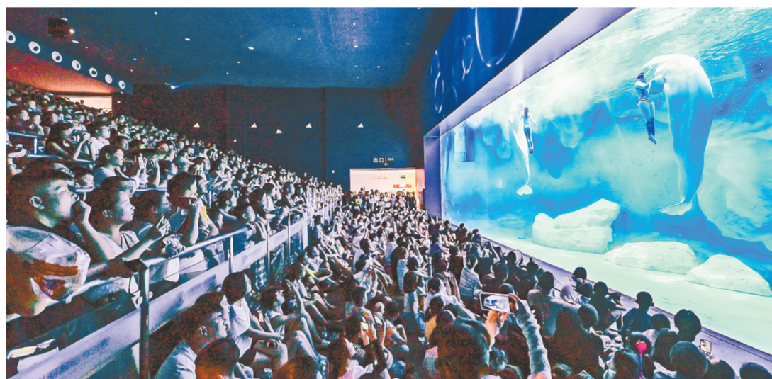
游客在郑州海昌海洋旅游度假区观看动物表演

每年的6月底至8月中旬是暑期出游高峰,避暑游、亲子游、研学游、文化旅游需求增长明显。作为中国主题乐园第一县的中牟,精心打造了别具特色的暑期系列活动,以丰富的文旅消费新业态、新模式、新场景,为八方游客量身定制了一场暑期“幻乐之旅”。