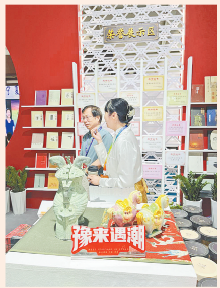
左图:华夏古乐亮相“博博会” 右图:河南博物院近年成果展示