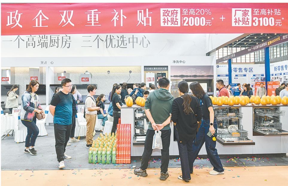
家电以旧换新活动吸引众多市民参与

新活动从9月10日持续至12月31日,消费者有充分的选购时间。同时,不强制回收旧家电,消费者可自愿选择交售旧机。