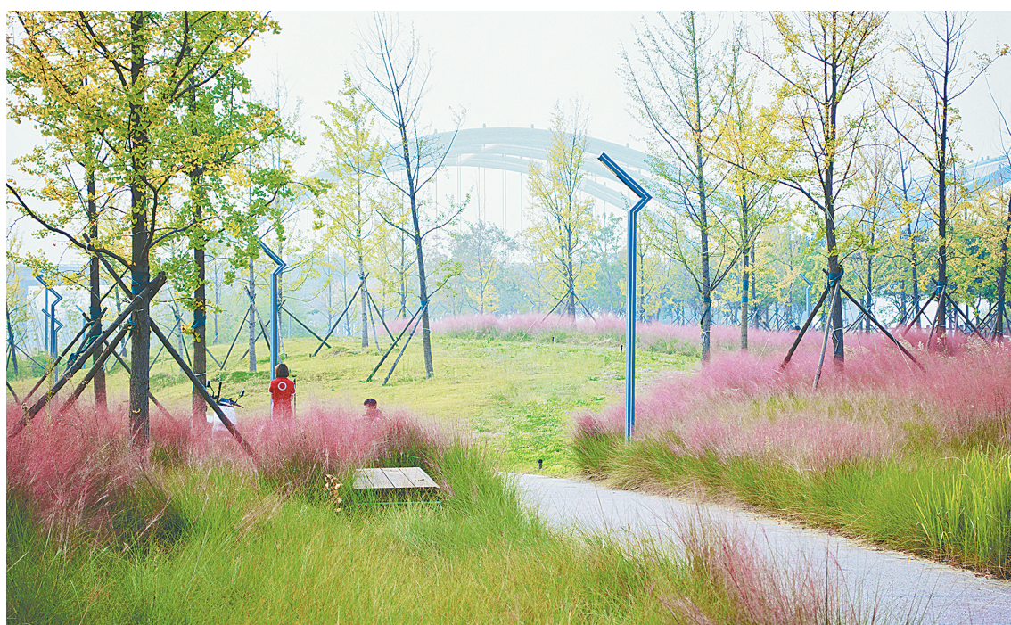
在这个色彩斑斓的秋天,金水区多地的粉黛乱子草如梦似幻般绽放,美到无需调色。快来S312沿黄生态廊道金水区段看粉黛起舞,感受浪漫吧。

本报讯(记者 刘地 通讯员 耿艺方)“强筋骨”练内功,“充电蓄能”强素质。日前,高新区2024年秋季科级干部主体培训班正式拉开帷幕,进一步引导全区党员干部自觉养成终身学习的好习惯,拧紧思想“总开关”,不断固本培元,为高新区高质量发展贡献新的力量。 此次培训,是按照市委组织部2023~2027年新一轮培训规划5年内乡科级干部进党校集中培训一遍的要求,举办的郑州高新区第二期科级干部主体班。来自全区各办事处、局(办),以及各部门推荐的科级干部以及管理岗同志共计37名学员,将在为期一个月的培训中,增强党性观念、适应知识更新、克服“本领恐慌”、提升自身修养。 据悉,为全面做好此次培训工作,高新区组织人事部和区委党校精心准备,在课程设置等方面做了大量工作,内容丰富、过程紧凑、特色鲜明,特别是邀请了省委党校、市委党校和郑州大学专家教授,以及省、市业务单位的专家到场授课,力争取得最佳的培训效果,切实把培训成果转化为推动工作的强大动力和有力举措,为高新区全年目标任务圆满完成贡献力量。