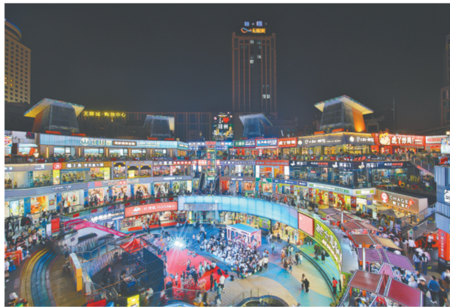
郑州二七商圈热热闹闹