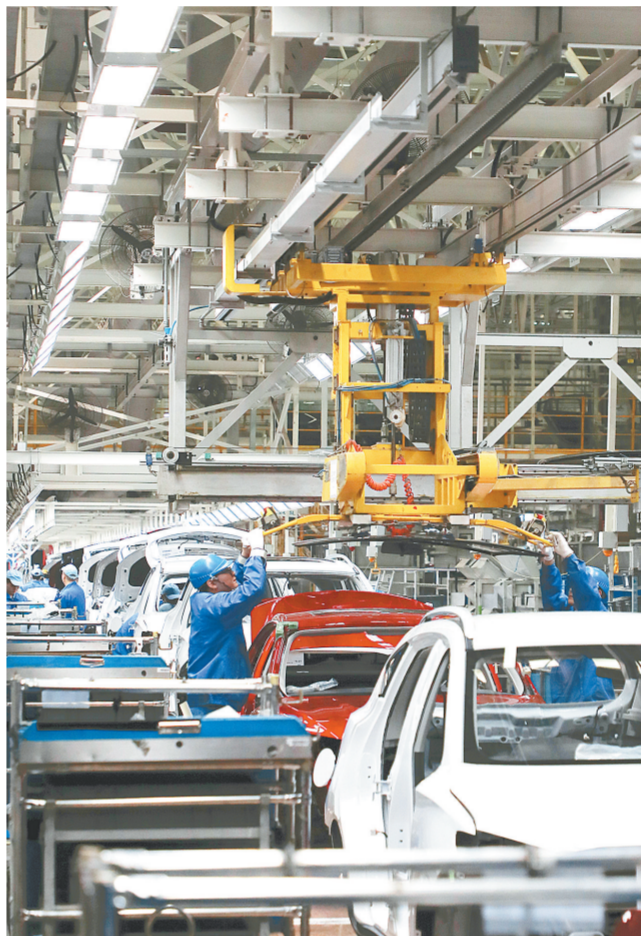
上汽乘用车郑州分公司车间一派繁忙

市统计局相关负责人表示,前三季度,全市经济整体延续良好发展态势,政策效应不断显现。但同时也要看到,经济回升向好基础仍需巩固,下一阶段仍要加快推动一揽子增量政策和已经出台的存量政策落地达效,不断巩固增强经济回升向好态势。