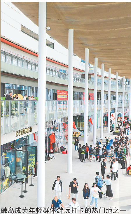
龙湖金融岛成为年轻群体游玩打卡的热门地之一

◆我市家电以旧换新已完成860644单(含线上),家装厨卫“焕新”完成15471单。截至10月29日,旧房装修、厨卫改造已申报2246人。