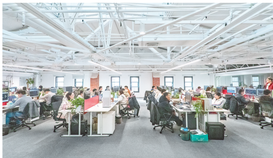
芝麻街的优越环境引得企业纷至沓来(资料图片)