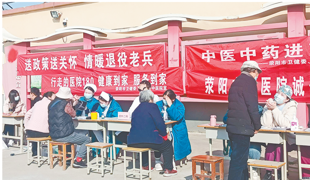
11月21日上午,荥阳市“拥军联盟”在城关乡李克寨村的广场上开展健康义诊活动。