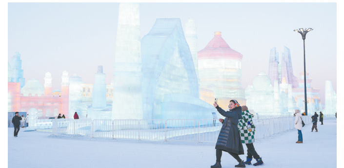
春暖冰城，告别将至，第26届哈尔滨冰雪大世界于2月26日正式闭园。本届冰雪大世界以“冰雪同梦 亚洲同心”为主题，总体规划面积100万平方米。园区运营以来，游客接待量创下新高。哈尔滨冰雪大世界是黑龙江冬季旅游的特色名片，成为我国冰雪经济蓬勃发展的生动注脚。

小组赛最后一轮，由于对手昆明足协U18队弃权，河南队凭借对阵山东的胜负关系优势，力压对手以小组头名的成绩进入到接下来的排位赛。